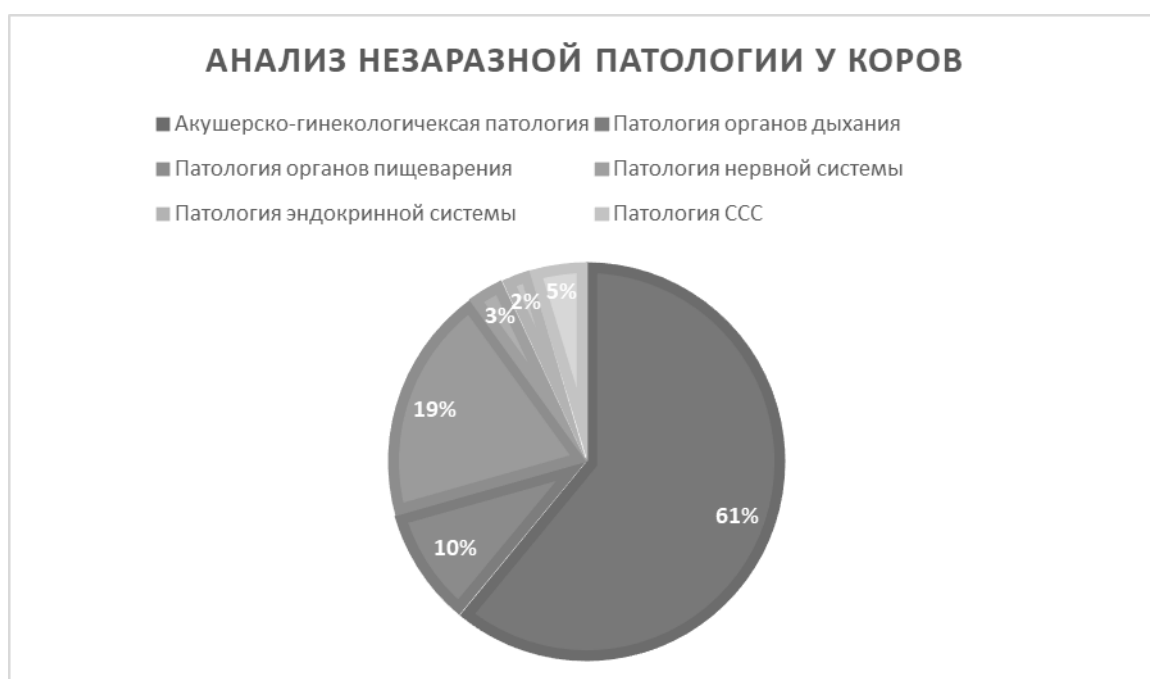
Рисунок 1. Анализ незаразной патологии у коров

Анализируя незаразную патологию в пределах хозяйств «Большие Салы» и ООО «Придонский», было установлено, что наибольший процент заболеваемости наблюдается среди акушерско-гинекологической патологии 305 голов (61%) от общей суммы исследованных животных. Патология органов дыхания была зарегистрирована у 48 голов (9,6%); патология органов пищеварения у 97 голов (19,4%); патология нервной системы у 15 голов (3%); патология эндокринной системы у 12 голов (2,4%); патология сердечно-сосудистой системы у 23 голов (4,6%).